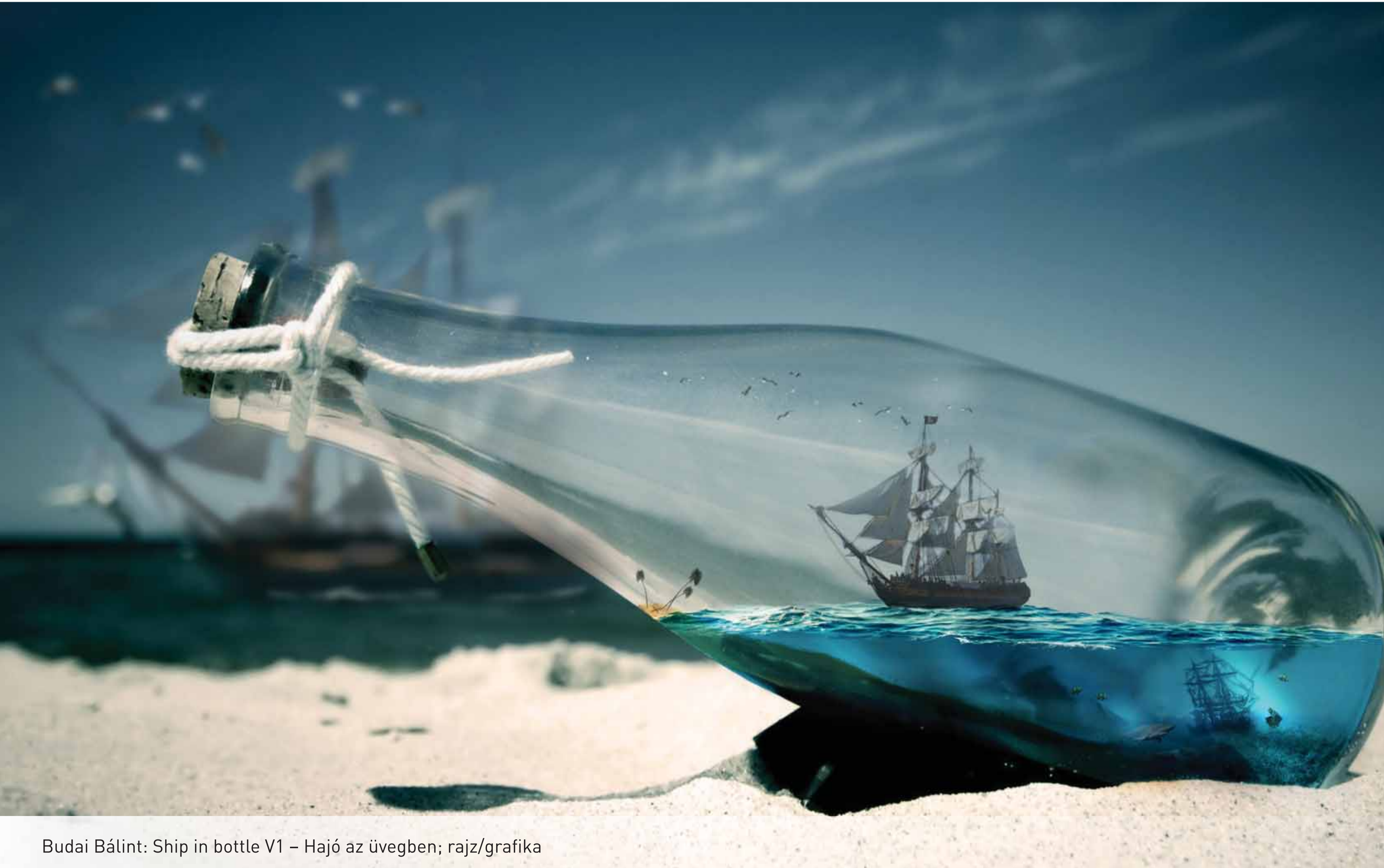
Budai Bálint: Ship in bottle V1 - Hajó az üvegben; rajz/grafika

C3 Kulturális és Kommunikációs Központ H-1022 Budapest, Szpáhi utca 20. H-1279 Budapest, Pf. 52 http://www.c3.hu